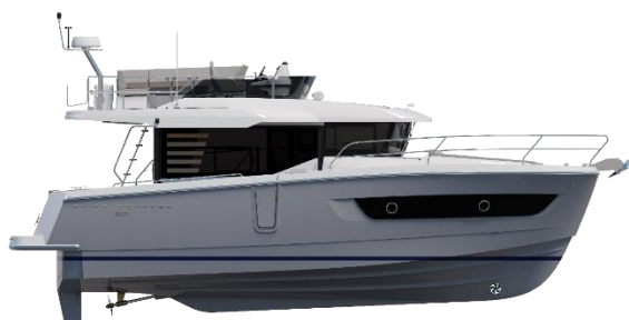
Profil Coque Signal Grey - Flybridge