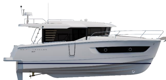
Profil - Sedan