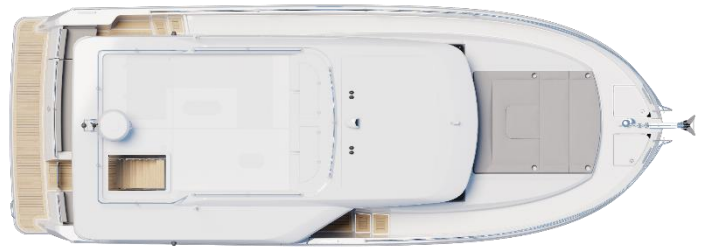
Sedan - Standard