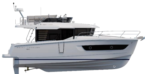
Profil - Flybridge