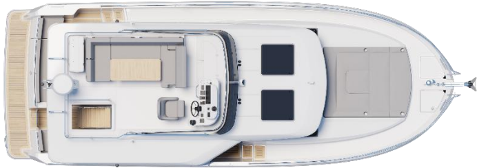
Flybridge - Option panneaux ouvrants