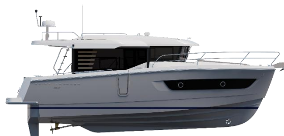
Profil Coque Signal Grey - Sedan