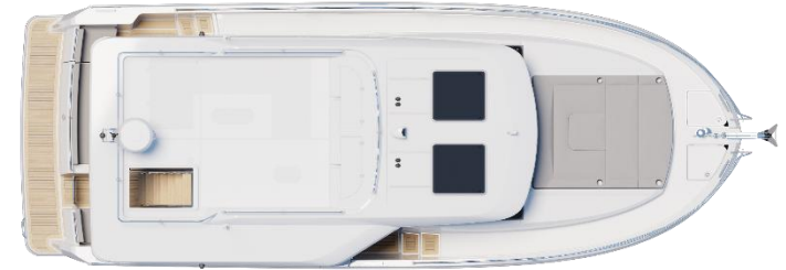
Sedan - Option panneaux ouvrants