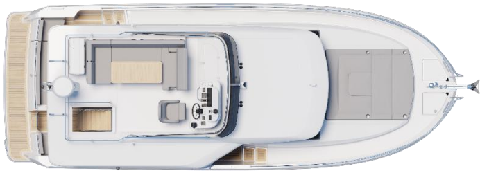
Flybridge - Standard