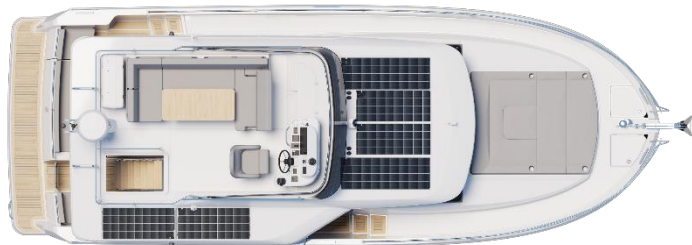
Flybridge - Option Silent boat