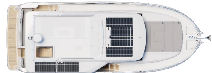
Sedan - Option Silent boat