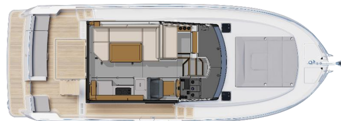
Pont principal - Option banquette coulissante